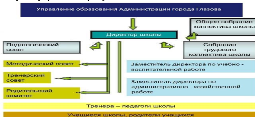
Рисунок 1 – Структура управления МБОУ ДО «ДЮСШ № 1» г. Глазова